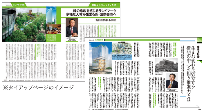
※タイアップページのイメージ

貴社のプロジェクトの特徴やそれがもたらす価値を客観的な視点から紹介します。経営トップのメッセージ、プロジェクトマネージャーへのインタビュー、関係者との対談など、訴求内容に合わせた展開が可能です。