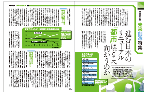
※編集ページのイメージ

特集冒頭の編集ページでは、再開発によってどんな未来がえられるのか、暮らし、ビジネスがどう変わるのかなどを解説。各地で進むプロジェクトへの読者の関心を高め、タイアップページへとつなぎます。