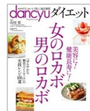
話題の「dancyuダイエット」

「dancyu」には「四季dancyu」のほか、個性豊かな人気のMOOKシリーズが3種！