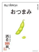
ワンテーマ深掘りの「技あり! dancyu」