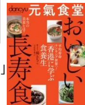
健康志向の「元氣食堂」