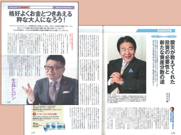
編集ページのイメージ

著名人や専門家へのインタビューを行い、個人型確定拠出年金の基本的な仕組みや税制上のメリット、活用にあたっての注意点を解説。読者にその利点を伝え、続くタイアップページへの関心を高めます。