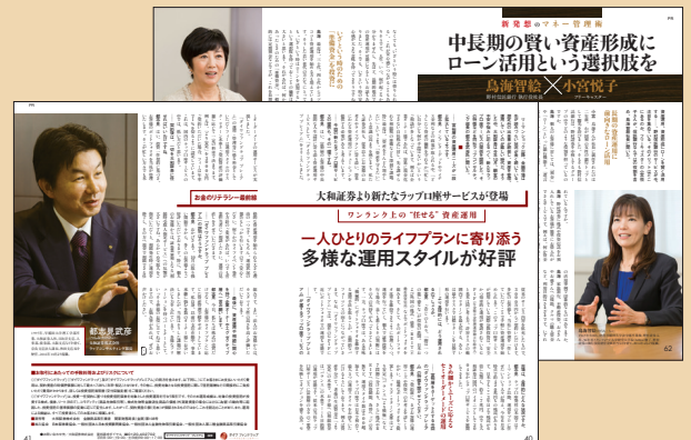
タイアップページのイメージ

客観的視点から、老後資金づくりに役立つ製品・サービスに関する記事をまとめます。個人型確定拠出年金や私的年金に使える商品などの利点を詳しく解説。読者の納得感を得やすいのがタイアップの特徴です。