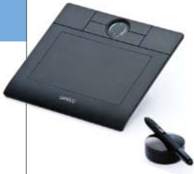
Bambooが、オリジナリティあふれるプレゼンを実現する。

ワコム「Bamboo」画面操作にも手書き入力にも適したA6ワイドサイズ。「消しゴム機能付き筆圧ペン」は、電池レス、コードレスで、通常のペンと同じ感覚で使うことができる。外形寸法は、200mm(W)×186mm(D)×10.7mm(H)。