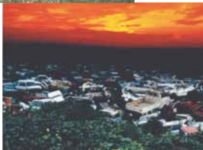
環境フォト大賞「繁栄の空蟬」(開催第2回)