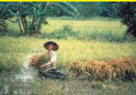
環境フォト大賞「収穫」(開催第3回)

特別応募締め切り → 2011年 9月 11日(日) ※伊藤忠商事賞への応募に限ります